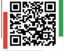
“我的退稅在哪裡？”工具