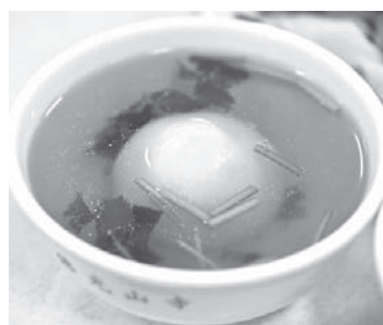
▲雲居樓齋堂午齋以大師的家鄉味「揚州大糰子」供眾。