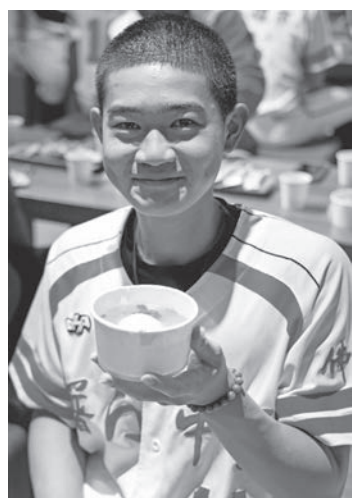
▲佛光山普門中學棒球隊員品嚐揚州大糰子。

【人間社記者許貞慧、李生鳳高雄報導】2月12日農曆正月十五日元宵節，佛光山開山祖師星雲大師圓寂兩周年紀念日，全球道場首次協心手作大師家鄉味「揚州大糰子」，供來寺信眾品嚐，食物賦予的滋味，成了憶師點滴，此刻將思念化作與師接心，以虔誠恭敬心緬懷大師的諄諄教誨，「人間佛教」的精神在這一顆顆象徵團圓、圓滿的糰子中傳承與實踐，寓意深遠。