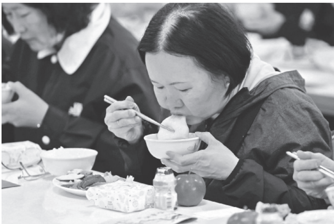
→2月12日佛光山開山祖師星雲大師圓寂兩周年紀念日，全球道場首次協心手作大師家鄉味「揚州大糰子」，供來寺信眾品嚐。

1994年4月初，大師返鄉探親，親人特別準備揚州地道家鄉菜「齋菜湯圓」招待，這久違的家鄉味，讓飲食無所求的大師例外多吃了好幾顆，因戰亂而身處異鄉，少小離家老大回，感觸特別深刻。