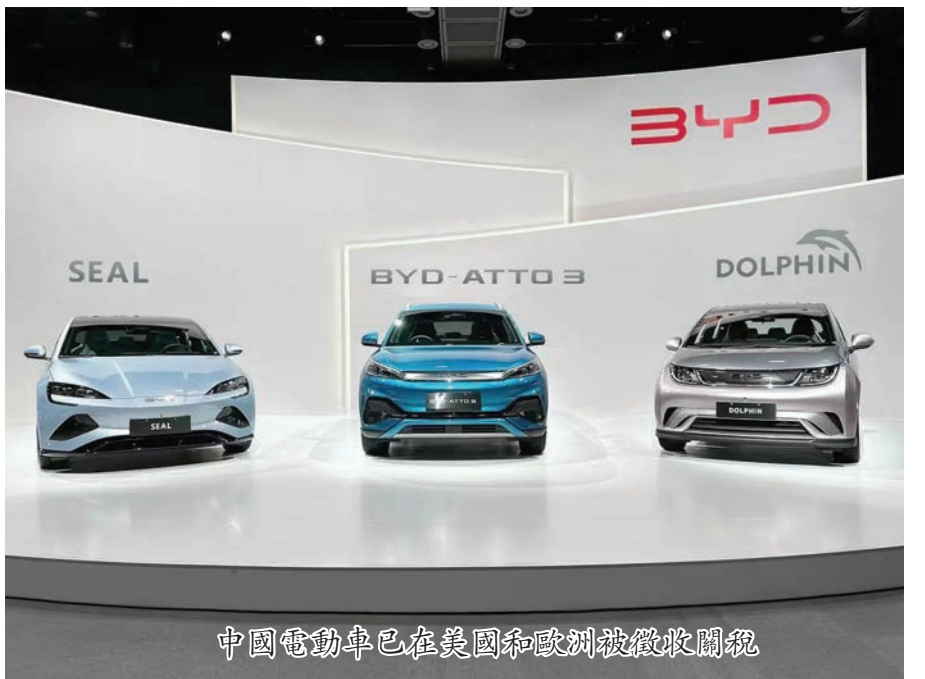
中國電動車已在美國和歐洲被徵收關稅