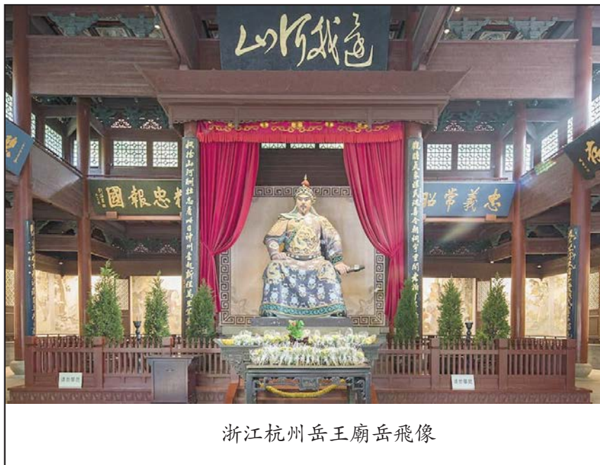
浙江杭州岳王廟岳飛像

郾城之役發生在南宋高宗紹興十年（金天眷三年，1140年）五月至七月，包括郾城（今屬河南漯河）與穎昌（今河南許昌）兩地的連