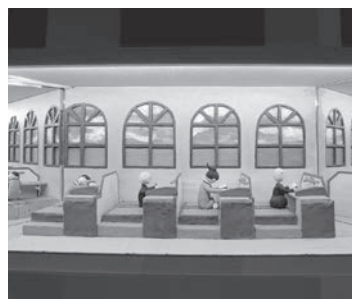
↑從展覽可以一窺佛光山叢林學院學生的生活。

【人間社記者李生鳳高雄報導】從1965年到2024年，佛光山開山祖師星雲大師推動僧伽教育至今已60年。從壽山佛學院到佛光山叢林學院，60年、2萬1900個日子，培養出6000位學子，弘法世界五大洲。透過「薪火傳燈——星雲大師僧伽教育60周年紀念展」，呈現60年來，大師為僧伽教育寫下的歷史。