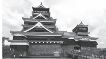
↑熊本城大天守與小天守。