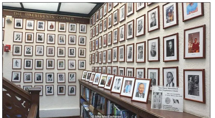
探險家俱樂部由3500名成員構成，他們分佈在包括紐約總部在內的全球32個分會