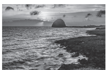
↓ 蘭嶼鑽頭岩海岸夕陽

蘭嶼位於台灣台東的東南外海49海浬處，面積約為45平方公里，環島公路全長約37公里，串接島上6個部落。若是騎著機車繞行一圈大約需要兩小時。沿途的海岸線上有許多奇特的火山岩石景點，其中，東清海灣的日出和珊瑚礁美景讓