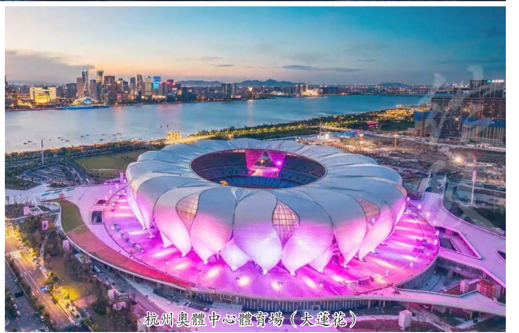
杭州奧體中心體育場(大蓮花)