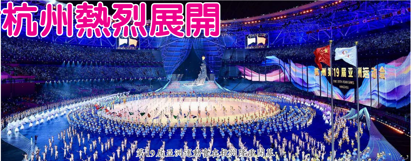
第19屆亞洲運動會在杭州隆重開幕

象棋(Xiangqi) - 這是中國象棋自2010年廣州亞運之後第二次成為亞運獎牌項目，也是