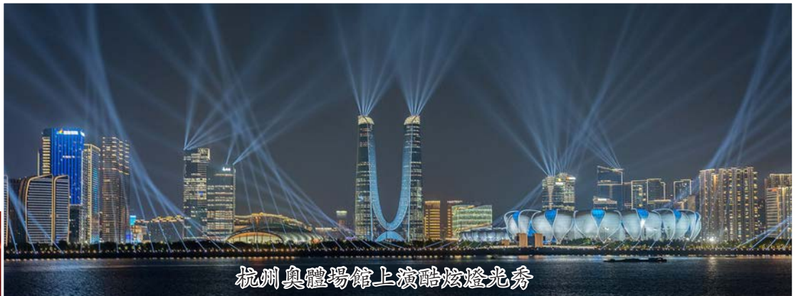
杭州奧體場館上演酷炫燈光秀